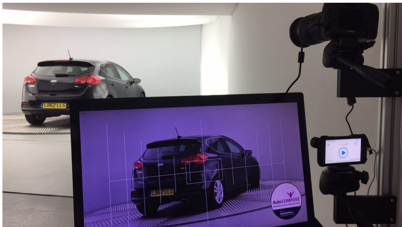
Le studio d'imagerie AutoOnShow, avec sa plateforme tournante, permet des clichés et des vidéos de haute

Surfant sur le développement croissant de la location avec option d'achat (LOA) ou de la location longue durée (LLD) dans les modes d'acquisition de véhicules neufs en France, BCAuto Enchères s'est facilement rendu compte que les acteurs du marché deviennent davantage fournisseurs de VO. De VO plus récents, d'ailleurs. « Ainsi, le succès de ces contrats auprès des consommateurs français, entraîne un renouvellement du marché des VO auquel BCAuto Enchères peut répondre : reprendre plus et plus vite, orienter davantage et précisément les VO, acheter au bon prix et vendre plus vite » , insistent les dirigeants de la société. Le modèle, en tout cas, a de quoi séduire.